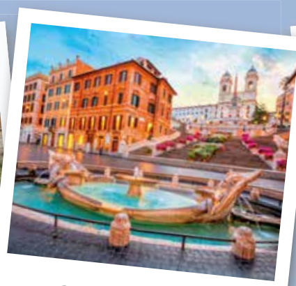
Piazza di Spagna